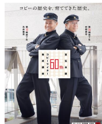
仲畑貴志氏、糸井重里氏による記念グラフィック