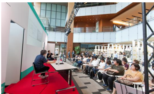
東京会場で行われたトークショーの様子

コピーライター養成講座開講60周年を記念し、人々を動かし、世の中に話題を提供してきた広告やコピー、コトバの力に様々な角度から光を当てるとともに、優れたコピーライターの発想法や広告クリエイティブの仕事の魅力について紹介する『コピージウム』を開催。東京、札幌、金沢、名古屋、福岡、広島、仙台の全国7か所を巡回、4万人を動員しました。