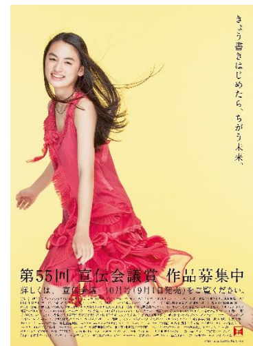
第55回 宣伝会議賞 作品募集中

審査員には仲畑貴志氏・箭内道彦氏・山本高史氏ら日本を代表するクリエイター100名が名を連ね、一次審査通過確率は約1%!応募数も増加を続けており、過去最大の応募数は52万3392点(第52回)にのぼります。