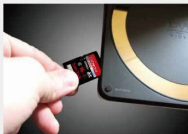
ポータブル DVD プレイヤーに