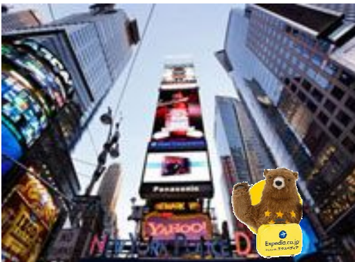
ニューヨーカー だベア

旅行先の「ホテル」「美術館」「道」... さまざまな場所で「エクスベア」君を入れて写真を撮影