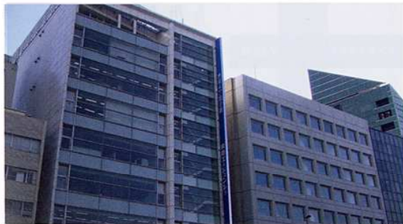
東急エージェンシー本社