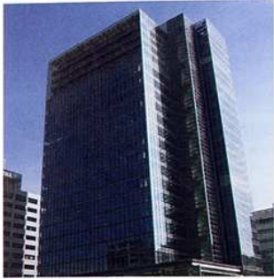
アサツーディ・ケイ本社

メディアニュートラルに対応する、ここ1～2年の組織の動きとしては、07年は「ADKタイアログ」設立によってダイレクト・コミュニケーションを強化、また08年にはインタラクティブ広告事業における営業力強化と業務対応領域の拡充などを目的