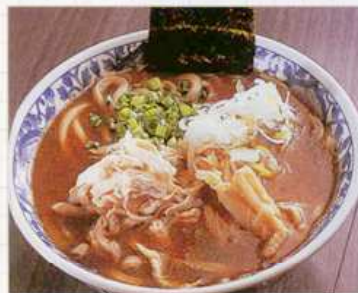
新潮流2 07年に引き続きポーターレス化が更に加速！ 本格的な味と濃厚なラーメンが合体 新発想の濃厚ラーメンが登場