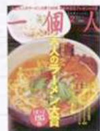
「一個人」 毎月26日発売 580円(税込) KKベストセラーズ

グルメライターたちは、記事を執筆する際、お店に入って、まずどんなところを見ているのか、何を書くのか。その着眼点に迫る。